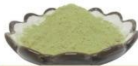
ผงใบบัวบก

เซนเทลล่า เอเชียติกา หรือที่รู้จักกันในชื่อว่า ใบบัวบก มีผลอย่างมากต่อผิวและมีประโยชน์ต่อสุขภาพ โดยรวมใบบัวบกเป็นสมุนไพรที่พบในภูมิภาคเขตร้อนชื้นและเขตร้อนต่างๆ ทั่วโลก มีทั้งประโยชน์ทางอาหารและยา